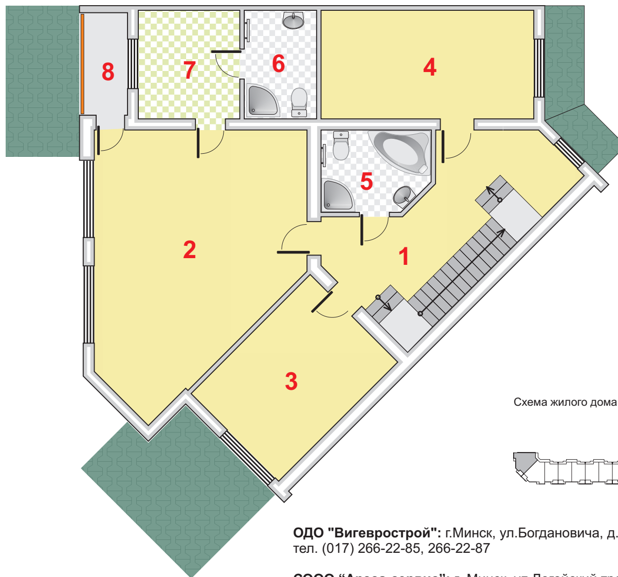
Схема жилого дома