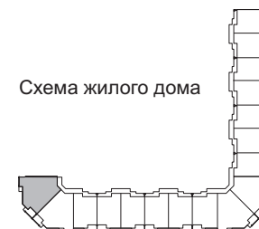
Схема жилого дома

ОДО "Вигеврострой": г.Минск, ул.Богдановича, д.122, комн. 4 тел. (017) 266-22-85, 266-22-87