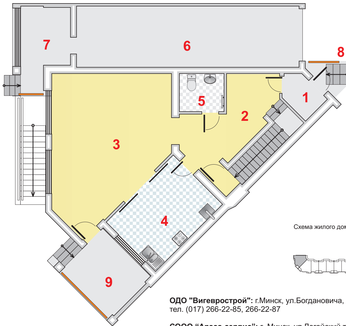
Схема жилого дома