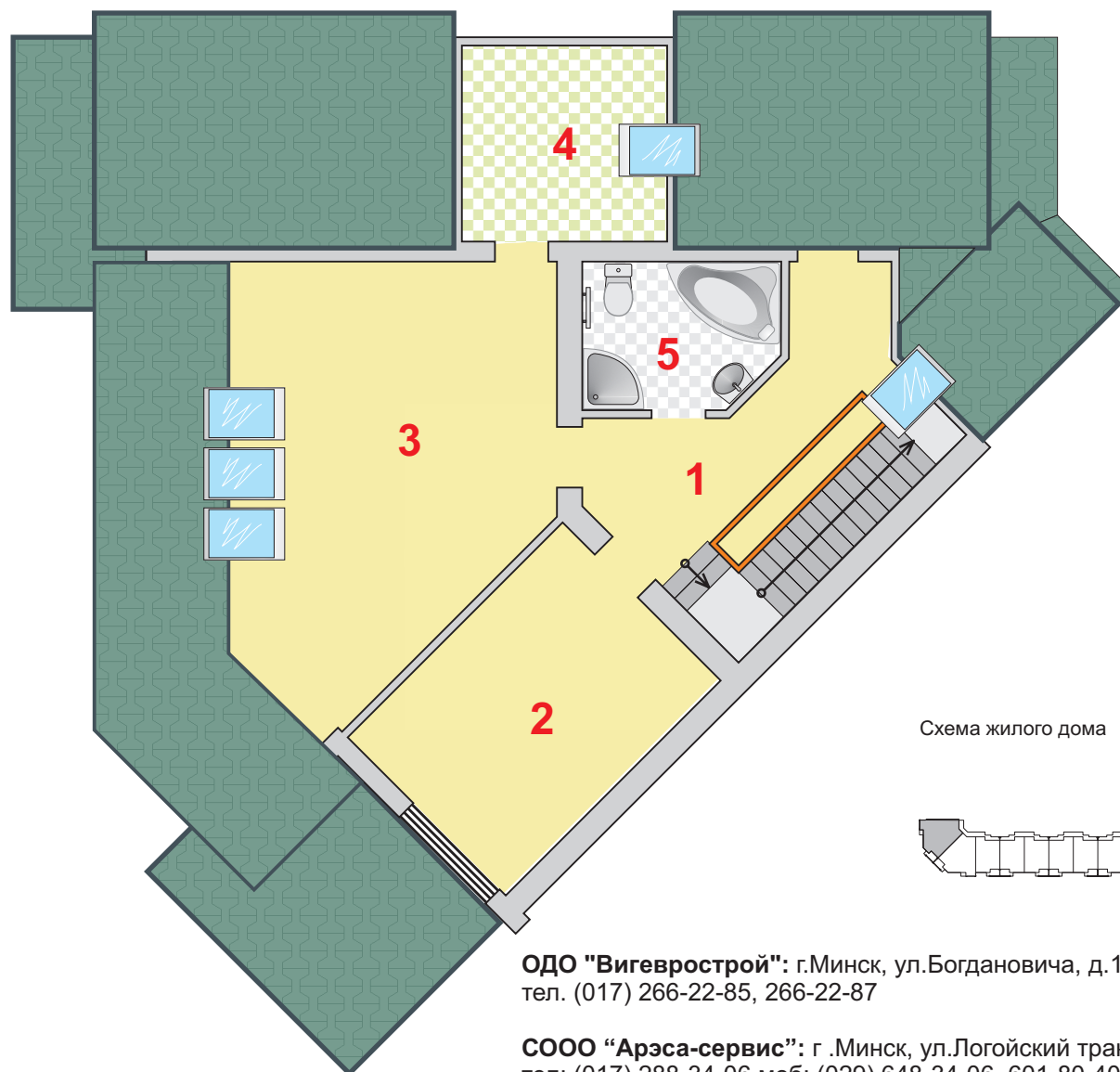
Схема жилого дома